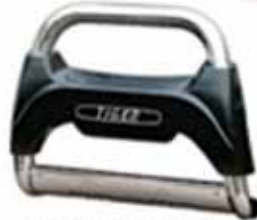
RUDEX ECONOMICA PROTECTOR PVC